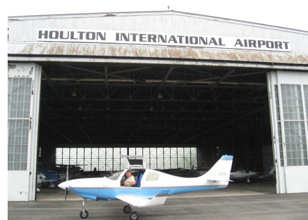
Houlton nära Kanadagräns tog det stopp, det saknades något dokument

Där övernattade piloterna i den lilla stan strax intill flygplatsen och flög vidare nästa dag mot Houlton