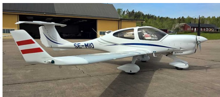
DA40 modell som undertecknad flyger i skolan

Den 18 maj 2019 kommer andra medlemsträff att äga rum i Västerås på flygplatsen Hässlö. Tanken är att medlemmarna kan samlas för en lunch och ett besök på flygmuseet. Naturligtvis är nyfikna gäster och alla familjemedlemmar välkomna. Vi kommer att samlas i Hässlö Flygföreningens lokaler där också lunchen kommer att äga rum.