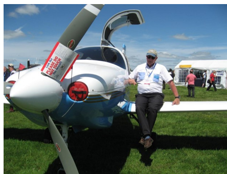
I väntan på köpare i Wycombe, UK 2017-06-01