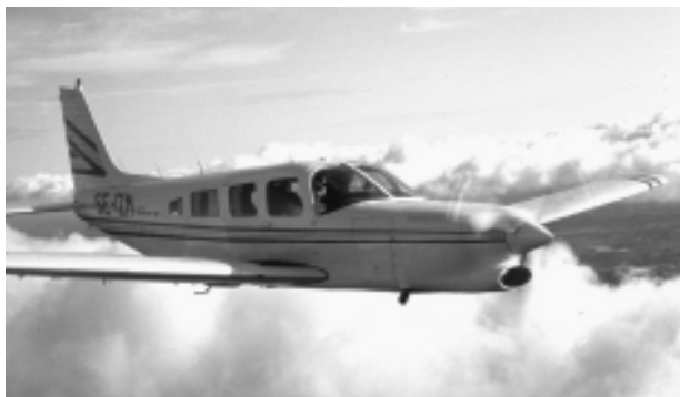
SE-IZM, Piper PA 32R-301T tillverkad 1981

Sedan 1987 är jag delägare i en Piper PA32R Saratoga. Det är ett fantastiskt bra reseflygplan, fullt IFR utrustat, inkl B-RNAV. Flygplanet har en marschfart på 160 kt och godkänt upp till 20000 ft.