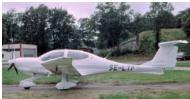
Generalagenten för Diamond demonstrerade denna nya 4-sitsiga Diamond BA 40 - Tidi med en bränslesnål dieselmotor för IFFR medlemmarna.

De flesta deltagarna ankom i egna flygplan och när samtliga kommit på torsdagskvällen stod det inte mindre än 15 mindre flygplan parkerade på Kalmar Flygplats. Ansvariga för evenemanget var