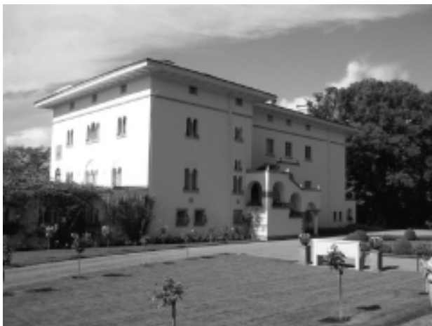
Solliden fotograferad från östra sidan.