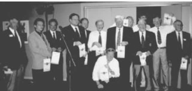
Mottagarna av IFFR standar samlade.

Söndag förmiddag ägnades åt en guidad rundvandring i Rønne, residensstaden på