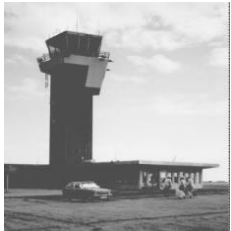
TWR på EKRN Rønne.