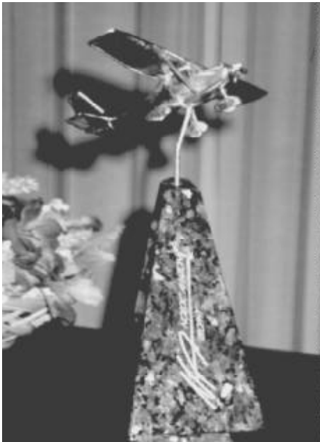
Nordic Aviation Trophy, en Cessna 150 i silver på ett fundament av svart granit från Larvik i Norge.