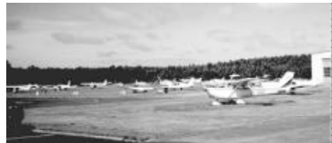
Flygplanparkeringen på Rönne flygplats

IFFR hotell var Fredensborg mellan centrala Rönne och flygplatsen. P.g.a. det stora deltagarantalet blev det fullbelagt och en del hade inkvarterats på Griffen, ett hotell av samma goda standard som Fredensborg, men som låg i centrala Rönne.