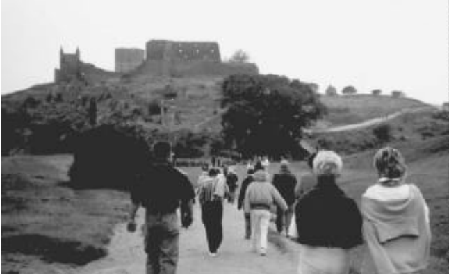
Deltagarna på väg upp mot Hammershus slotsruin.