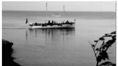
Båten Tor på väg ut från Helligdomsklipperne.

Vi kom till hamnen och det lilla samhället Gudhjem där en mindre båt med namnet Tor väntade på oss. Den var inte så stor att den kunde ta samtliga på en gång. På båten serverades dagens lunch eller "frokost" som det heter på danska. (Måltiden på morgonen heter morgenmad). Maten smakade mycket bra på sjön. Med Tor åkte vi västerut längs öns nordkust. Vi kom snart fram till fantastiska klippformationer, där nästan varje klippa hade formen av ett ansikte eller något djur. Här finns grottor, där det är möjligt att segla 18 meter in under Hammerknuden. Tor lade till vid de kända Helligdomsklipperne, där vi steg av och här mötte vi de som åkt med den andra bussen och inte fått plats på båten. Nu var det deras tur att ta båten tillbaka till Gudhjem. Här vid Helligdomsklipperne kan man gå in hela 55 meter i grottan "Sorte Gryde". Efter en skön promenad vid klipporna åkte vi vidare med bussen.